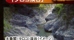
太魯閣(タロコ)渓谷(イメージ)