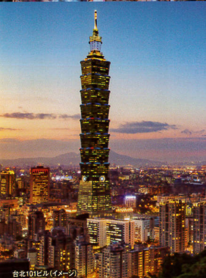
台北101ビル(イメージ)